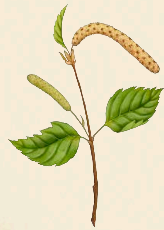
Björk ( Betula verrucosa )

Några av de ämnen (allergen) som du kan reagera på