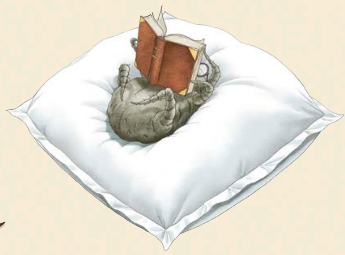
Kvalster ( Dermatophagoides pteronyssinus och Dermatophagoides farinae )