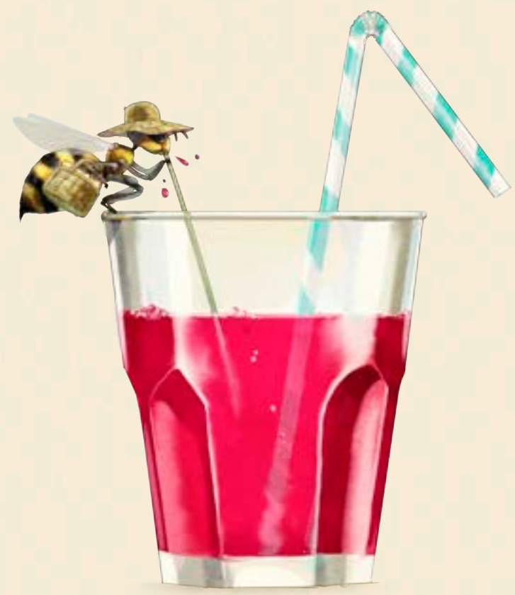
Geting ( Vespula spp )