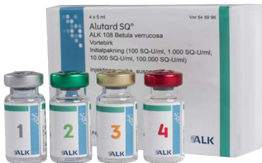
ALUTARD® SQ doseringssats

ALUTARD® SQ kan användas till vuxna och barn från 5 års ålder.